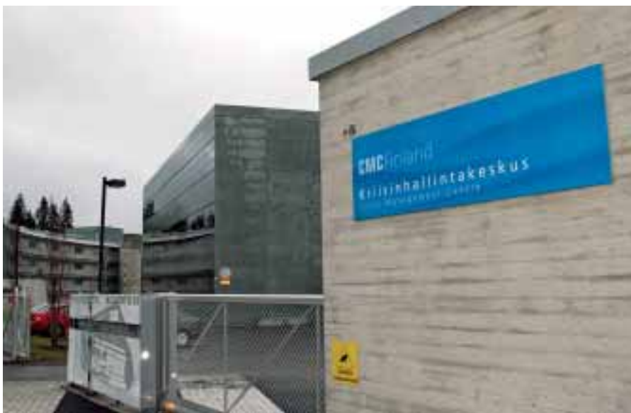
Kuopion Pelastusopiston yhteyteen sijoittuvat Kriisinhallintakeskus voisi ottaa hoidettavakseen valtion toimintoja aiottua enemmänkin.