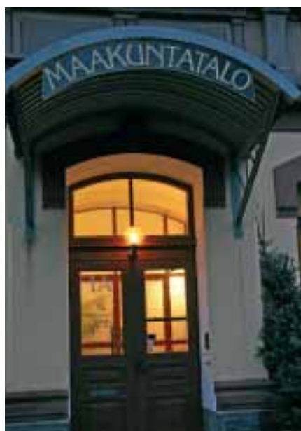
Pohjois-Savon Liiton organisaatio ja työnoja uudistuvat v. 2007 alusta.