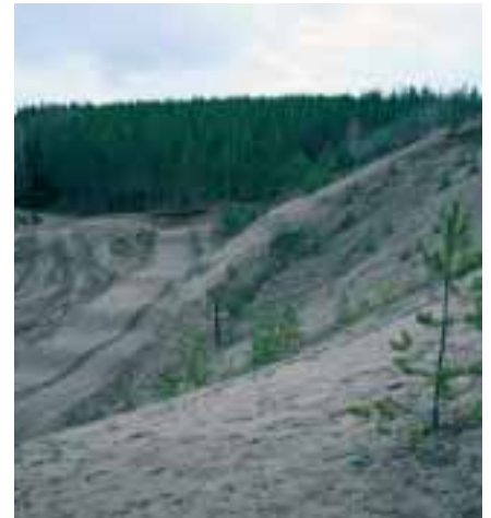
Kiviainesvarat ja harjut on inventoitu.

Pohjois-Savon pohjaveden suojelun sekä maa- ja kiviaineshuollon yhteensovittamiseen tähtäävä Poski-projekti on inventoinut maakunnan sora- ja hiekkavarat, kartoittanut arvokkaat harjuluontoalueet sekä selvittänyt korvaavien luonnon kiviainesten määrää ja laatua Pohjois-Savossa. Projektin tarkoitus on turvata hyvän pohjaveden saanti yhdyskuntien vesihuoltoon sekä laadukkaan kiviaineksen riittävyys ra-