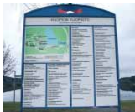
Kuopion yliopisto tiivistää yhteistyötään elinkeinoelämän sekä muiden yliopistojen ja korkeakoulujen kanssa.