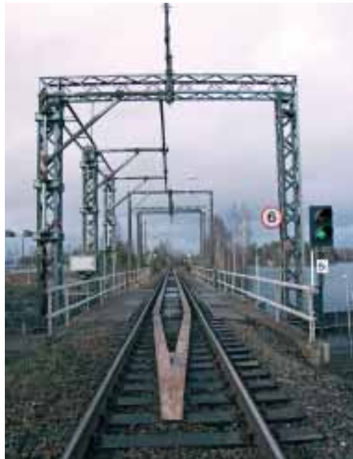
Raideliikenteen nopeuttaminen edellyttää Savonradan hyvää kuntoa.

Maa- ja metsätalouden hallinnonalalla painopisteinä ovat perusmaatalouden kehittäminen sekä maaseudun muun yritystoiminnan edistäminen. Elinkeinokalatalouden kehitystä tuetaan mm. kalanjalostusinvestoinneissa uusiin toimitiloihin. Toteuttamissuunnitelmassa esitetään alueellisen maaseutuohjelman rahoituskehysten säilyttämistä ennallaan, kun sitä uhkaa nyt noin 10 milj. euron vähennys.