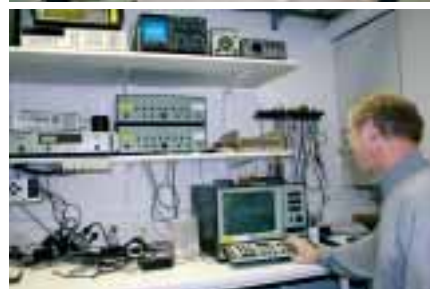
Uudella rakennerahastokaudella kehitetään yritystoiminnan kilpailukykyä yhä vahvemmin. Kuvat TTL:n äänilaboratoriosta.