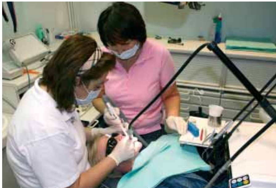
Hyvinvointiteknologiaa ja -yrittämistä koskevia Itä-Suomen makrohankkeita on valmisteltu tiiviisti Pohjois-Savossa.

Tämä tapahtuisi ulkomaalaisten yrittäjyyttä ja kuntien elinkeinopalveluorganisaatioiden Venäjä-osaamista edistämällä, juurruttamalla ulkomaalaisia maahanmuuttajia Itä-Suomeen mm. kotouttamispalve-