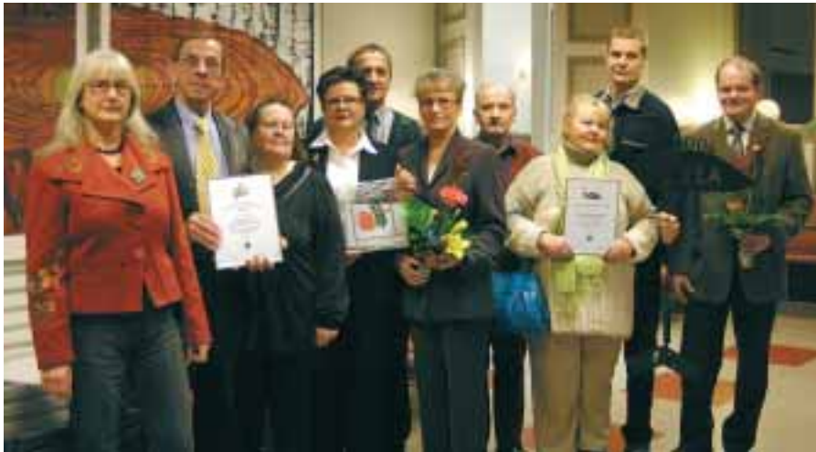
Kuvassa Vuoden Kaupunginosayhdistys -palkinnon saaneet Varkauden könönpeltolaiset sekä Vuoden Kylä -palkinnon vastaanottaneet Pohjois-Pielaveden kyläseudun edustajat.

Pohjois-Savon liiton maakuntavaltuuston syyskokouksessa palkittiin perinteisesti Pohjois-Savon Vuoden Kyläksi ja Vuoden Kaupunginosayhdistykseksi jo aiemmin valitut yhteisöt. Vuodesta 1987 lähtien myönnetyn Vuoden Kylä -palkinnon sai Pohjois-Pielaveden kyläseutu . Kolmannen kerran jaetun Vuoden Kaupungin-