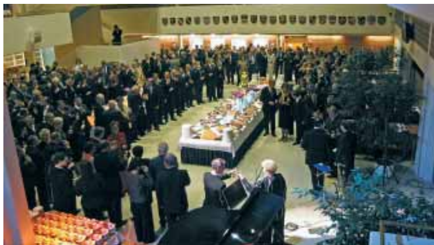
Pohjois-Savon liiton 70-vuotisjuhlat kokosivat Kuopion Musiikkikeskukseen päättäjiä ja vaikuttajia maakunnasta ja sen ulkopuolelta.

Pohjois-Savon liiton 70-vuotisjuhlien yhteydessä pidetyssä Pohjois-Savon valtuus-