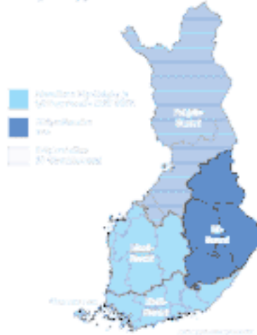
Alueellinen kilpailukyky ja työllisyystavoite 2007–2013

Itä-Suomeen kohdistuu rakennerahastovaroja tulevalla ohjelmakaudella kaikkiaan noin 1,1 miljardia euroa. Kun mukaan lasketaan hanketahojen etenkin investointi- ja kehittämishankkeissa merkittävä omarahoitusosuus, nousevat kehittämissäpanostukset moninkertaisiksi. Haasteena rahoittajille ja hanketahoille on EAKR- ja ESR-rahoituksen etupainotteisuus.