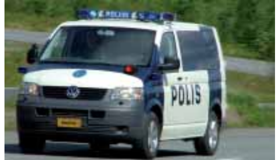
Poliisijoneuvojen varustus ja modernisointi voisi tapahtua lisälnessä.

tään Pohjois-Savon ympäristökeskuksen laboratorion siirtoa osaksi Suomen Ympäristökeskuksen Kuopiossa vahvistettavaa tutkimustoimintaa. Sen tutkimusalana olisi ympäristöriskien selvittäminen molekyylibiologisin menetelmin.