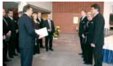
Yläsavolaiset onnittelivat liittoa.

kunnan kokouksessa päätettiin, että valtuuskunta osallistuu Suomen sodan juhluvoiteen ottamalla sen yhdeksi vuoden 2008 seminaariteemakseen. Vuonna 2007 valtuuskunta kokoontuu alkuvuodesta Helsingissä teemanaan "Talous ja hyvin-