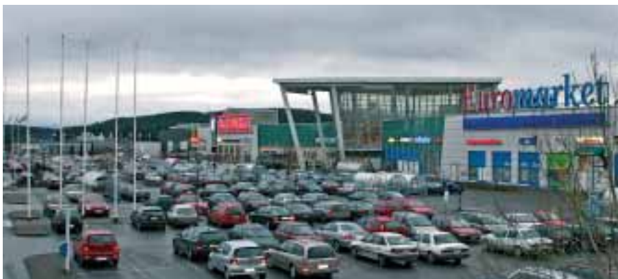
Automarketit ovat keskittäneet ostovoimaa Kuopioon.

Kuluttajien asiointivirtoja 39 tuotteen ja palvelun hankinnoissa kuntien välillä selvittänyt Suomen Gallup Oy:n valtakunnallinen tutkimus kertoo, että Iisalmen kaupungilla on Pohjois-Savossa paras suhteellinen vetovoima. Kuopio ylitti vertailukaupunkien indeksikeskiarvon Varkauden jäädessä sen alle. (IL)