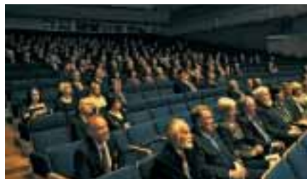
Valtuuskunnan juhlaseminaarin yleisöä.

kunnan kokouksessa päätettiin, että valtuuskunta osallistuu Suomen sodan juhluvoiteen ottamalla sen yhdeksi vuoden 2008 seminaariteemakseen. Vuonna 2007 valtuuskunta kokoontuu alkuvuodesta Helsingissä teemanaan "Talous ja hyvin-