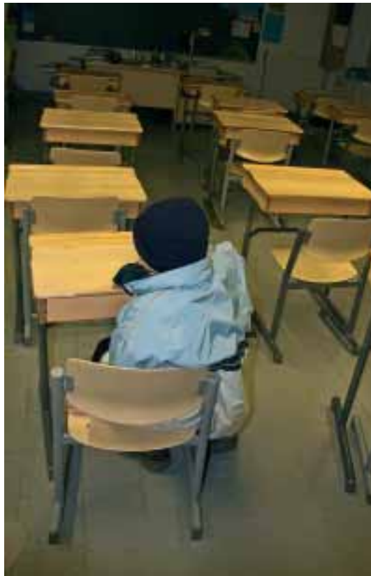
Kunnallista opetustoimeakin joudutaan uudistamaan oppilasmäärien pienentyessä.

Strömmer muistuttaa, että työryhmä ei päästä mistään vaan kokoaa pohja-aineistoa kunnissa tehtäviä johtopäätöksiä ja ratkaisuja varten sosiaali- ja terveydenhuolto- ja palvelujen organisoimista. Vuoden 2007 alkupuolella työryhmä järjestää teemakokouksia mm. mielenterveys- ja päihdehuoltoasioista sekä vanhustenhuollosta. Tässä yhteydessä selvitetään myös henkilöiden saatavuutta sekä väestökehitysnäkymiä ensi vuosikymmenelle. (IL)