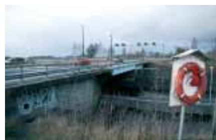
VT5:n parantaminen Päiväranta-Vuorela-välillä etenkin Kallansiltojen osalta on keskeinen maakunnan kehittämiskohde.