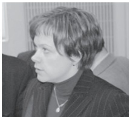
Ulkomaankauppaministeri Paula Lehtomäki

Kuopiossa Venäjän kaupan seminaarissa puhuneen ministeri Lehtomäen mukaan tämän vuoden alussa Venäjällä voimaan astunut uusi tullilaki vakauttaa toimintatapoja ajan mittaan joustavammiksi. Ongelmia on vielä mm. palveluissa ja energian kaksoishinnoittelussa. Korkean tason kaupallisten suhteiden edistymisestä huolimatta ei pidä unohtaa paikallistason yhteyksiä Venäjälle. Perinteiset kahdenväliset kaupalliset foorumit kuten 90-luvun