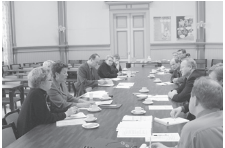
Yrittäjyyssryhmä piti järjestäytymiskokouksensa Pohjois-Savon liitossa.

Yrittäjyyssryhmä on kokoontunut kahdesti kesään mennessä. Ensimmäisessä kokouksessa tarkasteltiin Pohjois-Savon tilannetta yritysten kilpailukykyyn ja aluetalouden näkökulmasta, keskusteltiin ryhmän työmenetelmistä ja toiminnan painopisteistä sekä täsmennettiin asiat, joita ryhdytään ensiksi valmistelemaan. Toiseen kokoukseen päätettiin valmistella esitykset EU:n