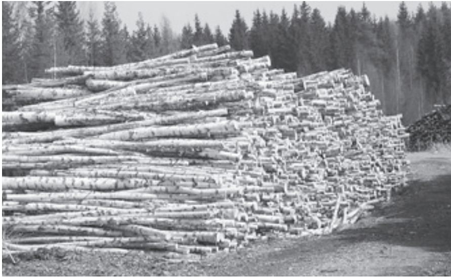
Metsäklusterille on tärkeää puun jalostusasteen nostaminen ja viennin vahvistaminen.

Metsäklusterin merkitys Pohjois-Savossa on edelleen huomattava. Klusterin osuus maakunnan bkt:sta on 13 %, mutta teollisuustuotannon arvosta jo noin kolmannes. Viennistä metsäklusterin osuus on yli 50 %. Metsä- ja metalliklusteri vastaavatkin yhdessä liki 90 %:sta maakunnan vientituloista.