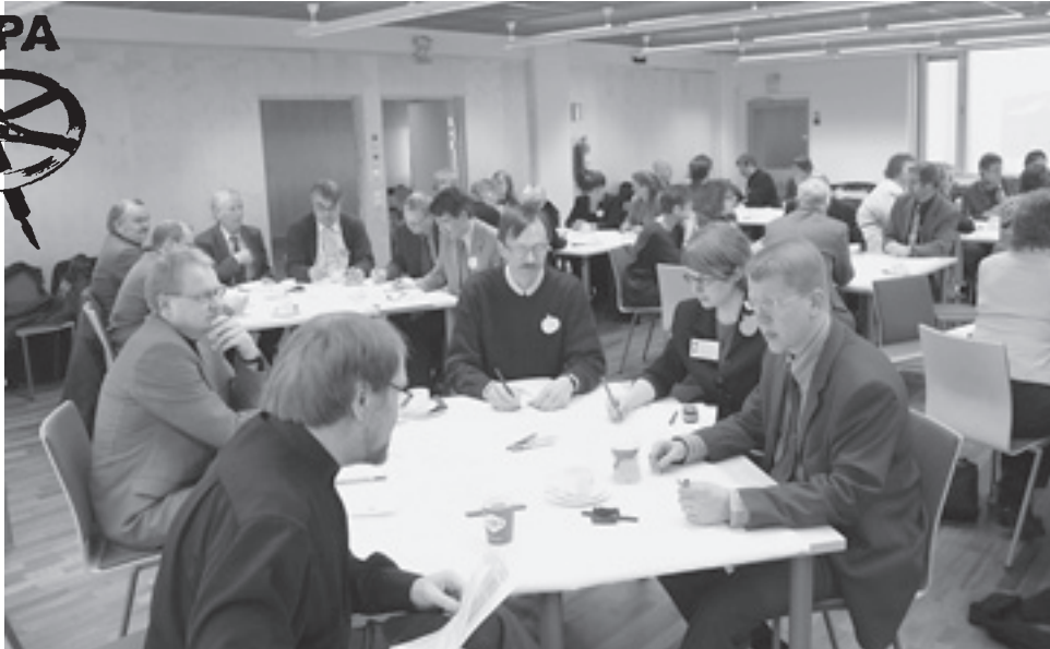
Sompa-hanke järjesti alkuvuodesta ison aloitusseminaarin työryhmätyöskentelyineen. Se kokosi hyvin työllisyysasioiden sidostahoja.

Pohjois-Savon tuoreimman aluetaloustalouden mukaan maakunta on selvittänyt taloustaantumasta v. 2001–2003 muuta maata paremmin, mutta silti työttömyys on maakunnassa varsin korkea ja tilannetta heikentävät tänä keväänä ilmoitetut mittavat irtisanomiset. Vakaavien työttömyysasteiden edessä Pohjois-Savon liiton hallinnoima Sompa- eli Pohjois-Savon oppiva työllisyysstrategia -hanke tavoittelee maakunnan keskeisten toimijoiden laajalla yhteistyöllä uusia ratkaisuja positiivisemmaksi työllisyyskehitykseksi.