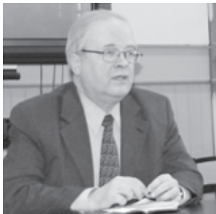
Valtiosihteeri Risto Volanen

– On arvioitu, että v. 2011 mennessä nykyisestä noin 22 000 valtion keskushallinnon työpaikasta 4 000–8 000 voisi alueellistua maakuntiin. Se ei toteudu nykyisten työntekijöiden siirtämisellä vaan ns. luonnollista tietä, sillä seuraavan vuosikymmenen alkuun mennessä noin 10 000 keskushallinnon työntekijää jää eläkkeelle. Nyt ei ole kyse valtionhallinnon kokonaisten yksiköiden siirrosta pääkaupunkiseudulta muualle. Tähtäimessä on toimintojen tai yksiköiden osien mielekäs siirtyminen alueille, missä niillä on synergiaa siellä olevien toimintojen kanssa. Kuopion seudun