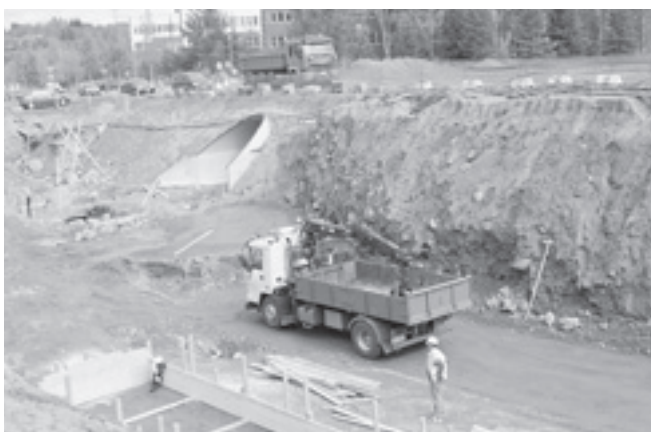
Kuopion seudun maakuntakaavassa määritellään mm. asuinalueiden laajenemissuuntia pitkälle tulevaisuuteen.

Maakuntakaavatyöryhmä ja Kuopion seudun neuvottelukunta käsittelevät konsulttityön tuloksia syksyllä 2004. Maakunta-