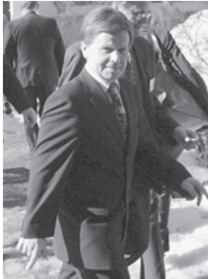
Kauppa- ja teollisuusministeri Mauri Pekkarinen