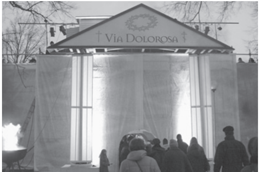
Via Dolorosa -pääsisäisnäytelmässä yhdistyvät matkailu- ja kulttuuriklusterien tavoitteet.

Myös Tervon Lohimaa on kehittynyt viime vuosina voimakkaasti ja alueella tehdään merkittäviä palveluja parantavia uusinves-