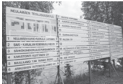
Yritystukihakemusten määrä on nousussa.