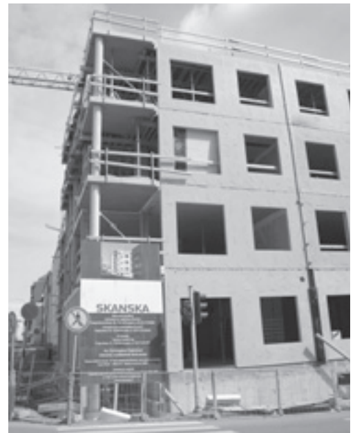
Asuntotuotanto on säilynyt Kuopion seudulla vilkkaana.

Hallituksen asunto-ohjelmassa kehitetään asumistukijärjestelmää mm. tulorajamääri-tysten osalta. Aravalainoituksessa alennetaan ennen v. 1990 myönnettyjen lainojen korkoja 4,25 %:iin nykyisestä 5,5:stä ja mahdollistetaan lyhennysaikataulun uusi-minen. Omistusasumisen tukijärjestelmis-sä pidetään ensiasunnon ostajien korko-vähennys nykyisenä mutta lapsiperheiden alijäämähyvityksen maksimimääriä nostetaan. ASP-järjestelmässä omavastuukorko alenee 3,8 %:iin, korkotuen maksuaika pitenee kuudesta kymmeneen vuoteen ja omarahoitusosuus laskee. Omistusasuntojen korkotukilainoituksen omavastuukorko alenee 3,8 %:iin tänä vuonna.