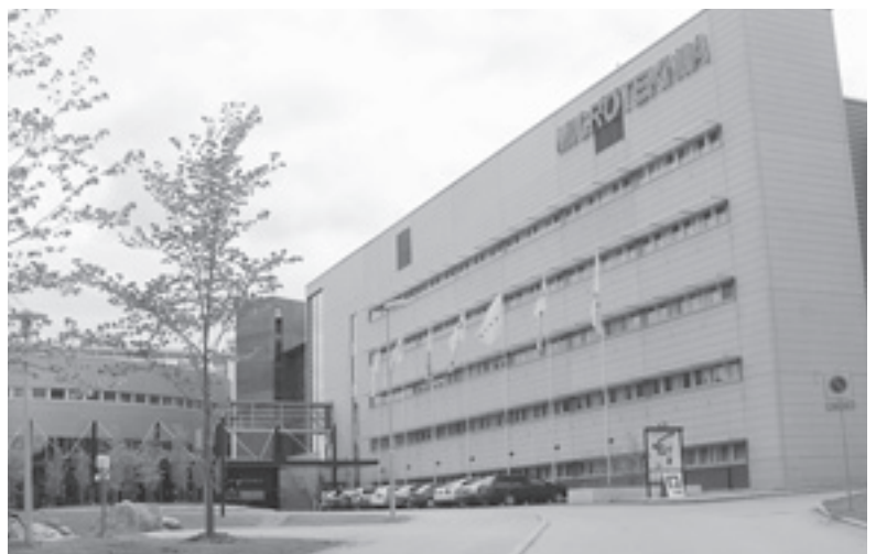
Kuopion tiedepuiston rakentamiseen ja toiminnallisuuteen on panostettu lujasti myös tavoite 1 -ohjelman EU-tuilla.