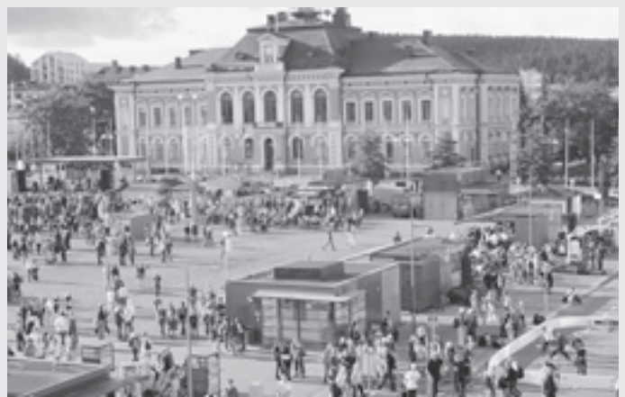
Pohjois-Savon maakuntajuhla starttaa Kuopion torilta.

• Pohjois-Savon maakuntajuhlaa on vietetty vuodesta 1998 alkaen. Juhlan ajankohta pyritään sijoittamaan mahdollisimman lähelle maakuntapäivää, joka on historiallinen perustein 15. elokuuta. Tänä vuonna juhla järjestetään elokuun viimeisenä viikonloppuna 27.–28.8. Kuopiossa Elonkorjuujuhlan yhteydessä. Maakuntajuhla onkin viime vuosina yhdistetty suurempiin tapahtumiin, jolloin kaikki osapuolet ovat saaneet tilaisuuksista mahdollisimman suuren hyödyn. Viime vuonna juhlaa