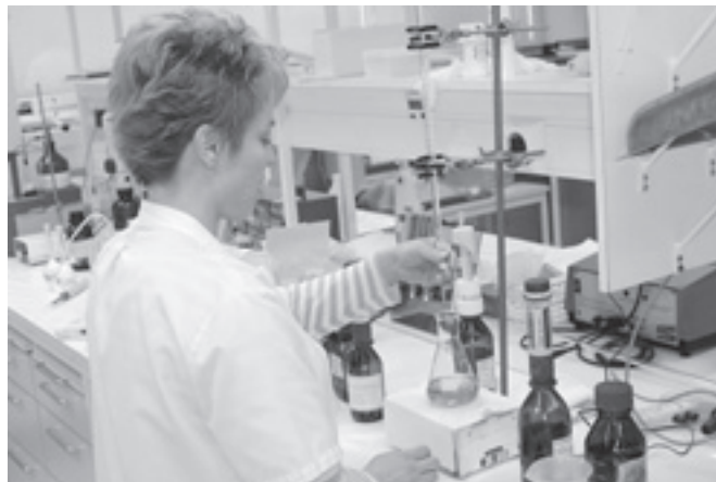
Hyvinvointiklusterin merkitys on kasvussa Pohjois-Savossa.

jestelmissä ja tiedonhallinnassa on puutteita mm. sähköisissä vuorovaikutteisissa asiakaspalveluissa, vaikka internet-verkkoa hyödynnetään laajalti. Sosiaalitoimi on useissa kunnissa edellä terveydenhuoltoa sähköisten palvelujen käytössä, mutta sosiaalialalla ei ole luotu standardiratkaisuja. Se johtaa yhteensopivuusongelmiin. Alan kansallinen kehitysohjelma kehittää toivottavasti yhtenäisemmän perusohjelmistorakenteen, joka mahdollistaa pienemmillekin ohjelmistotoimittajille tuoda tuotetaan avoimeen käyttöympäristöön.