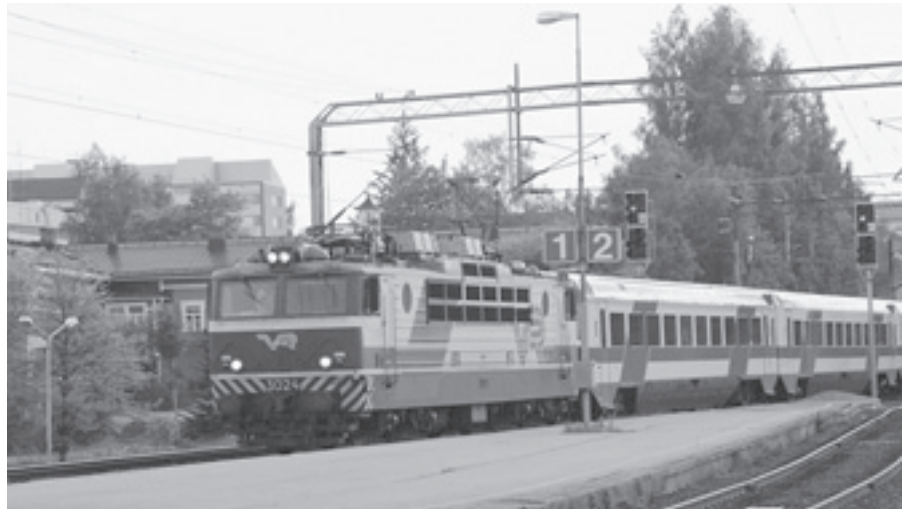
Savonradan liikennöinnin nopeuttaminen on maakunnan edunajamisen yksi kärkiasioita.

Pohjois-Savon liitto luovutti yhteistyössä useiden muiden eurooppalaisten tavoite 1 -alueiden kanssa yhteisen kannanoton aluekomissaari Michael Barnierille toukokuussa 2003. Kannanoton ydinsisältönä on vaatimus nykyisten tavoite 1 -alueiden säilyttämisestä rakennerahastopolitiikassa v. 2006 jälkeen. Pohjois-Suomen ja Pohjois-Ruotsin tavoite 1 -alueiden kanssa valmisteltiin yhteinen kannanotto seuraavaa rakennerahastokautta koskien. Se esiteltiin komission ja Euroopan parlamentin edustajille kesäkuussa 2003 Brysselissä. Kannanoton pääsisältö on Suomen ja Ruotsin nykyisten tavoite 1 -alueiden saattaminen pysyvästi rakennerahastopolitiikan kohteeksi v. 2006 jälkeen. Pohjois-Savon ja Itä-Suomen kannanottoja