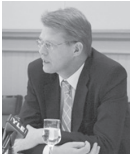
Pääministeri Matti Vanhanen

Pohjois-Savon kehittämishankkeita koskevaan kannanottoon sisältyi valtion toimien alueellistaminen, kuntatalouden vakau-