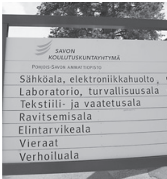
Elintarvike- ja ravitsemisala kaipaavat lisää nuoria koulutukseen Pohjois-Savossa.

Suomen Elintarviketyöläisten liiton alue-sihtööri Seppo Hämäläinen pitää EU:n