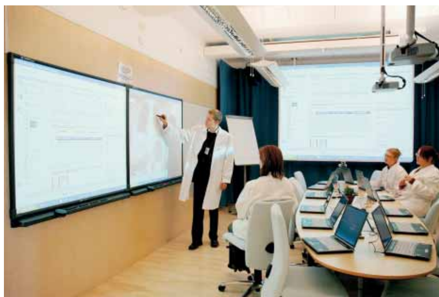
Työskentelyä Kuopion WellTeknian Brainstorming -ympäristössä.