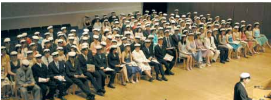
Kuopion Kallaveden lukion ylioppilaita keväällä 2006.

Lakiluonnoksen mukaan kuntia veloitetaan esittämään valtioneuvostolle suunnitelma palvelujen järjestämisestä vuoden 2007 syyskuun alkuun mennessä. Sillä pitää olla kunnanvaltuuston hyväksyntä. Mikäli kunta ei tee suunnitelmaa, valtioneuvosto päättää sen palvelujen järjestämisestä. Kunnilla olisi aikaa sopia yhteistoiminnasta kesäkuun 2008 alkuun mennessä. Jos sopimuksia ei synny, valtioneuvosto voi pakottaa kunnat yhteistyöhön.