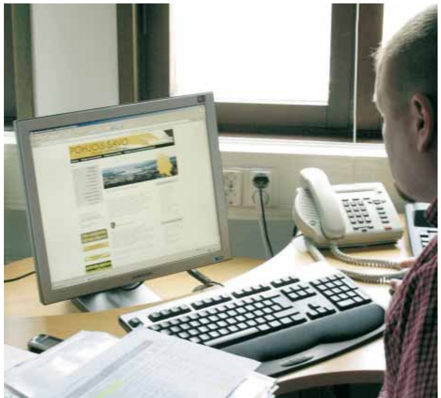
Pohjoissavolaisilla EU-rahoittajilla on vielä hieman tukivaroja myönnettävänä.