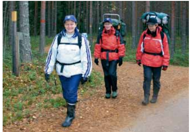
Patikoojia Vesannon retkeilyreitillä.

Paikkaosoite löytyy ao. kunnan omasta palvelukartasta – jos kunnalla sellainen on – tai osoitteesta http://kansalaisen.karttapaikka.fi . Työkaluista on lyhyt esittely nettisivuilla. Itse karttaohjelmassa ovat tarkemmat käyttöohjeet.