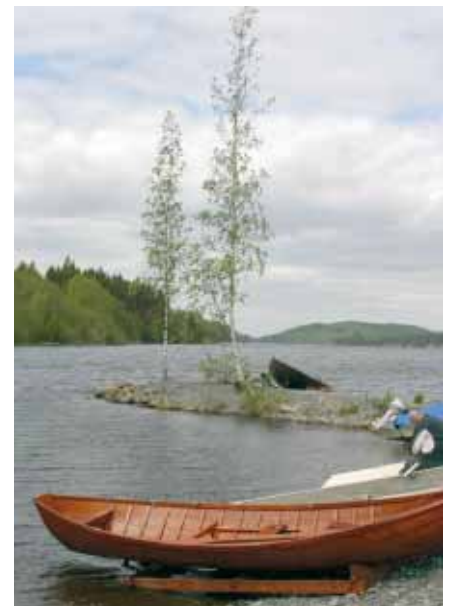
Useat maakuntakaavaehdotuksen palautteet koskivat Kuopion Neulaniemeä.