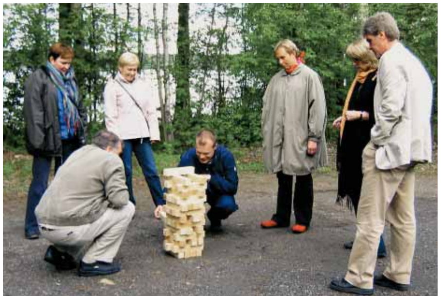
Pulmia ratkottiin hymyssä suin, mutta varsin keskittyneesti.