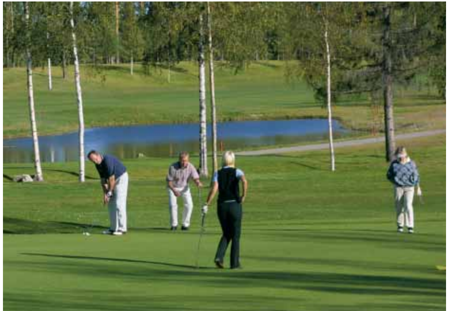
Golf-kenttä on nostanut huomattavasti Nilsin Tahkon alueen kesämatkailumääriä.

Samanaikaisesti on valmisteltu valtakunnallista matkailun kehittämisstrategiaa. Sitä laadittaessa lähtökohtana on aiempaa vahvemmin alueellisten näkökohtien ja painotuserojen huomioon ottaminen.