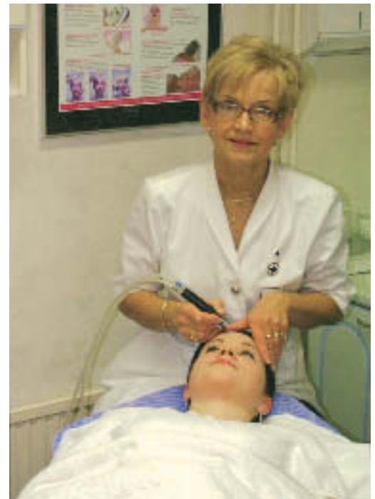
Pohjois-Savon vastuulle tuli mm. hyvinvointiyrittäjyyden edistäminen Itä-Suomi-ohjelman jatkovalmisteluissa.