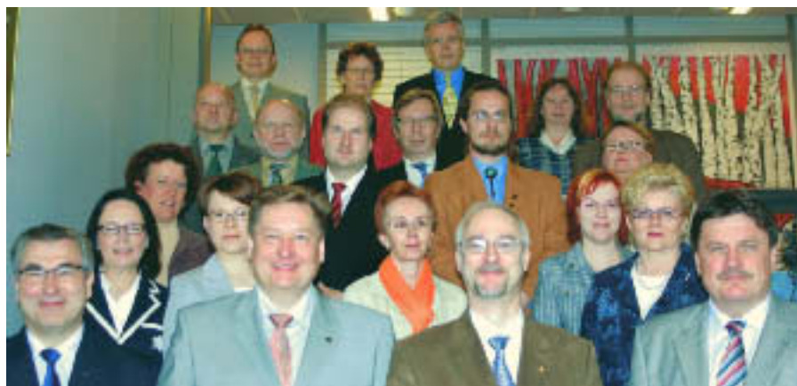
Pohjois-Savon maakunnan yhteistyöryhmän jäseniä.

Jokaisessa maakunnassa toimii EU:n rakennerahasto-ohjelmien toimeenpanoa ja alueen kehittämistoimenpiteiden yhteensovittamista varten maakunnan yhteistyöryhmä (MYR). MYRin asettaa maakuntahallitus. Kokoonpanossa ovat kumppanuusperiaatteen mukaisesti tasapuolisesti edustettuina maakunnan liitto ja sen jäsenkunnat, valtion aluehallintoviranomaiset sekä keskeiset työmarkkina- ja elinkeinojärjestöt eli nk. sosiaalipartnerit. Toimikausi jatkuu ainakin siihen saakka, kunnes nykyisen ohjelmakauden rakennerahasto-ohjelmat on toteutettu ja suljettu.