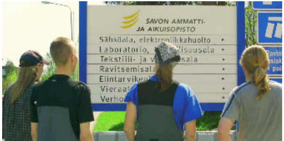
Sompa-hankkeen rekrytointitutkimuksen mukaan ammatilliseen koulutukseen kohdistuu kasvuyrityksistä entistä suurempia haasteita.

Paikallisen työvoimapolitiikan mielekkään sisällön arvioidaan vaihtelevan toimialoit- tain. Metall- ja puunjalostusteollisuudessa panostetaan kasvuun tuotekehityksellä ja innovaatioilla, joita julkinen taho voi tukea esimerkiksi laadukkaana työvoiman ja osaamisen siirtäjänä. Työvoimaa haetaan kuitenkin sieltä, mistä sitä on saatavissa - tarvittaessa myös maakunnan rajojen ulko- puolelta. Vierasmaalaista työvoimaa ei kuitenkaan pidetä ainakaan toistaiseksi katta-